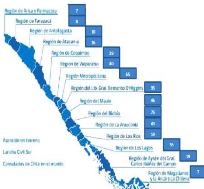
Oficinas Servicio de Registro Civil e Identificación por regiones.

Oficinas del Servicio de Registro Civil e Identificación que funcionarán en la Región de Ñuble.