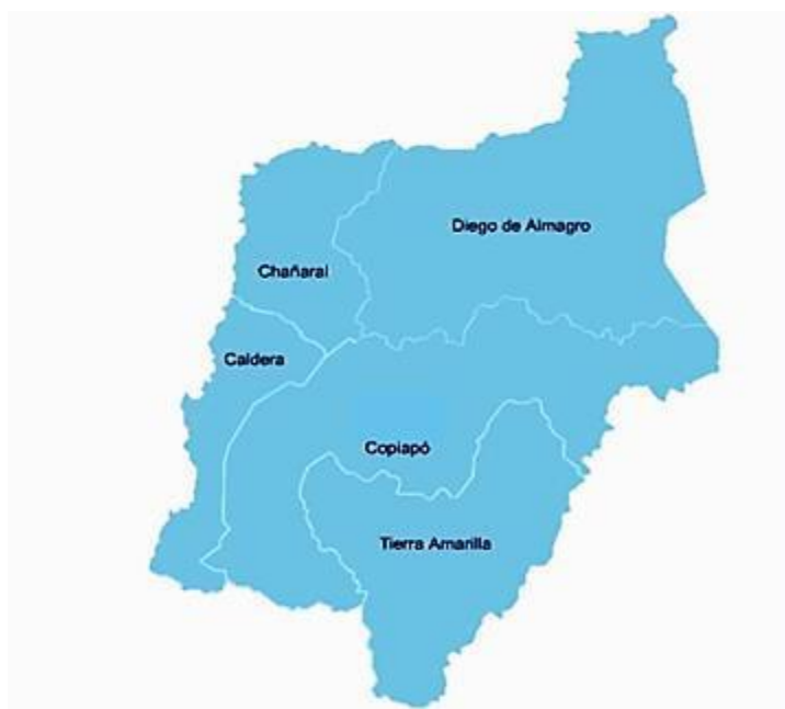
Figura 1. Mapa territorial SLEP Atacama.

contexto de encierro y uno rural. En la comuna de Diego de Almagro, se distribuye en 3 establecimientos educacionales urbanos, un CEIA y uno rural. En el territorio, la mayor concentración de establecimientos rurales se encuentra en la comuna de Tierra Amarilla (6), las cuatro comunas restantes, sólo presentan un establecimiento rural en cada una.