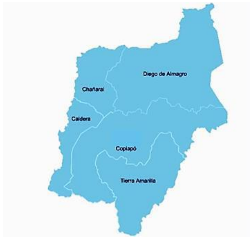
Figura 1. Mapa territorial SLEP Atacama.

rural y 15 jardines VTF, contando con un total de 46 establecimientos educacionales. En la comuna de Tierra Amarilla, existe un número de 5 establecimientos educacionales urbanos, 5 rurales, con un jardín VTF, siendo un total de 11 establecimientos educacionales. En la comuna de Caldera, se cuenta con 5 establecimientos educacionales urbanos, con un centro de educación de adultos, una escuela rural y 3 jardines VTF, con un total de 9 establecimientos educacionales. En la comuna de Chañaral, cuenta 7 establecimientos educacionales urbanos, un establecimiento de educación especial, uno en contexto de encierro y uno rural. En la comuna de Diego de Almagro, se distribuye en 3 establecimientos educacionales urbanos, un CEIA y uno rural. En el territorio, la mayor concentración de establecimientos rurales se encuentra en la comuna de Tierra Amarilla (6), las cuatro comunas restantes, sólo presentan un establecimiento rural en cada una.