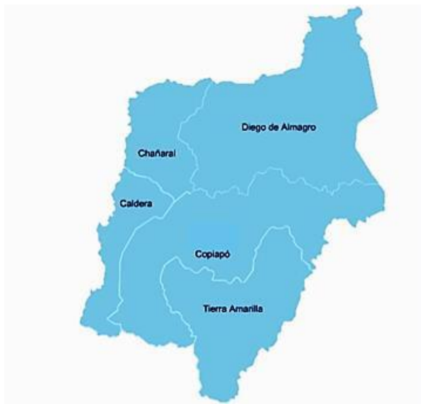
Figura 1. Mapa territorial SLEP Atacama.

total de 11 establecimientos educacionales. En la comuna de Caldera, se cuenta con 5 establecimientos educacionales urbanos, con un centro de educación de adultos, una escuela rural y 3 jardines VTF, con un total de 9 establecimientos educacionales. En la comuna de Chañaral, cuenta 7 establecimientos educacionales urbanos, un establecimiento de educación especial, uno en contexto de encierro y uno rural. En la comuna de Diego de Almagro, se distribuye en 3 establecimientos educacionales urbanos, un CEIA y uno rural. En el territorio, la mayor concentración de establecimientos rurales se encuentra en la comuna de Tierra Amarilla (6), las cuatro comunas restantes, sólo presentan un establecimiento rural en cada una.